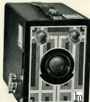
Formaat der afbeeldingen 6 x 9 cm.

Deze Brownie is een eenvoudige, pretentieloze camera, die toch verschillende goede eigenschappen bezit. Vooreerst is het een van de meest compacte toestellen in het formaat 6 x 9 cm.; dan heeft zij ronde hoeken, zoodat er tegen het meedragen in jaszak of tasch geen bezwaar kan zijn. De zwart metalen rand om het voorstuk en om de lens maken dit eenvoudige toestel tot een sierlijke camera. En vanzelfsprekend is de camera betrouwbaar.