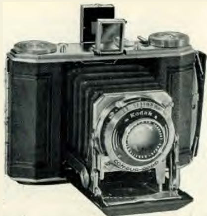
Formaat der afbeeldingen 4.5 x 6 om.