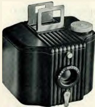
Formaat der afbeeldingen 4 x 6,5 cm.