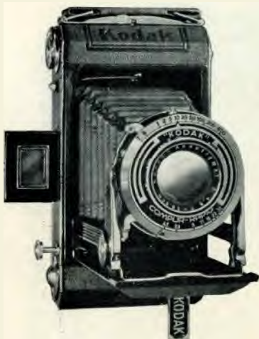
Formaat der afbeeldingen 6 x 9 ere