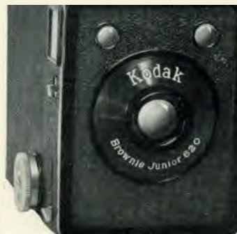
Formaat der afbeeldingen 6 x 9 ent.

Details: Gecontroleerde Meniscus lens met vast brandpunt. Zuiver werkende sluiters voor tijd- en momentopnamen. Twee heldere zoekers, een ten dienste bij horizontale-, een bij verticale opnamen,