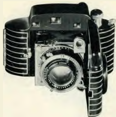
Formaat der albaedgingan 28 40 mm

Prijs: Kodak Bantam Uitrusting bevattende: Kodak Bantam met K.A. f. 6.3; twee Pana- tomic films; leeren tasch met schouderriem fl. 22.50.