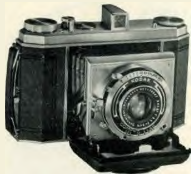
Formaat der albestangan 6 x 6 cm.

Prijzen: Met K.A. f. 3.5 f1.70.00 — Met K.A. f. 4.5 11.62.50 — Met Xenar lens 1.3.5 f1. 77.50 — Met Zeiss Tessar lens f. 3.5 f1.90.00 - Lederen tasch met schouderriem voor alle modellen f1.4.00 — Kodak film No. 620: Regular f1. 0.55, Verichrome fl. 0.65, Panatomic of S.S. Pan 11.0.75.